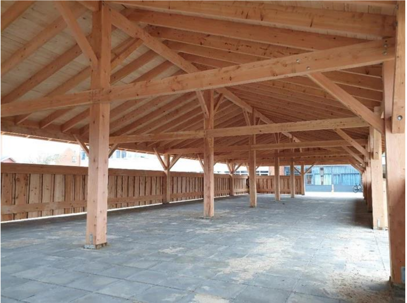
Billedet af Bålhytten set indefra (Shelterbyg)

Vi vil arbejde henimod, at indsætte såvel vinduer som stalddøre, så bålhytten kan lukkes helt.