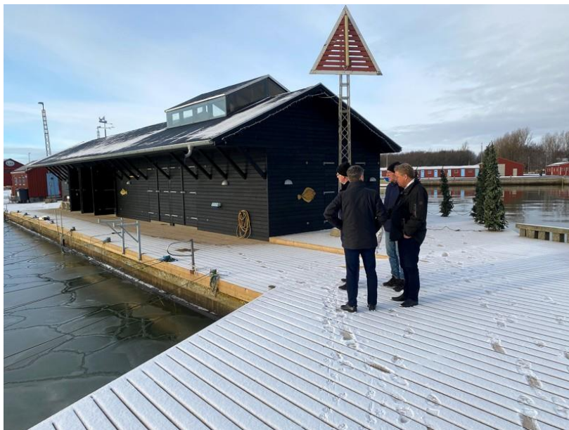
Alternativt forslag- noget i den retning