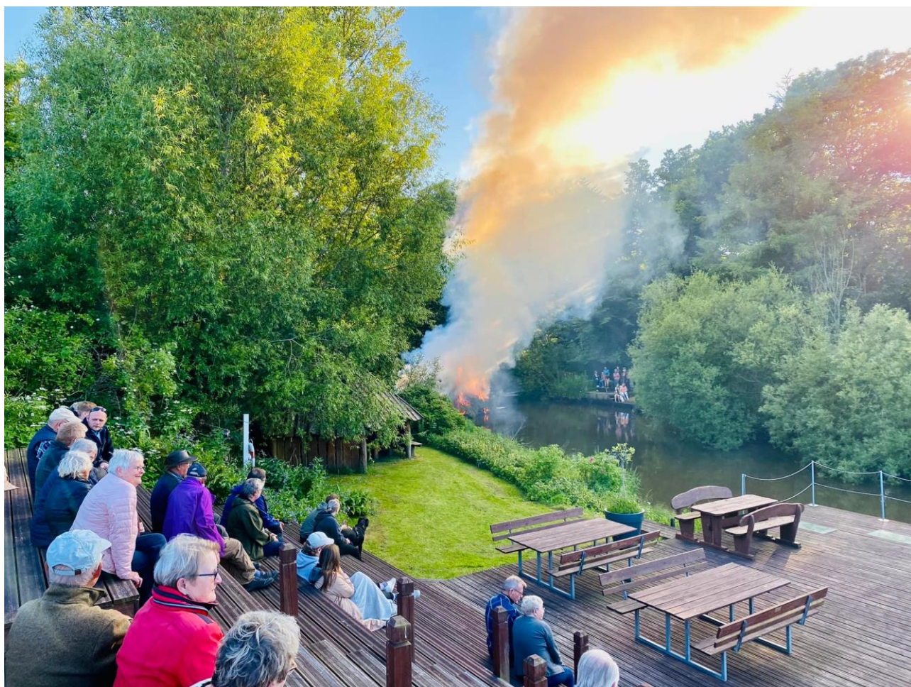
Sankt Hans aften på krogrunden