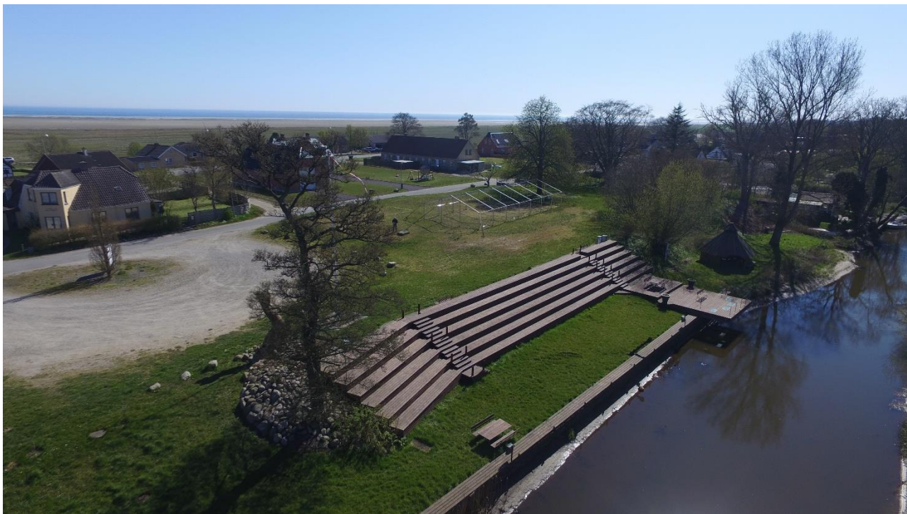
Dronefoto af krogrunden med trappen til åen og teltrammen i baggrunden.