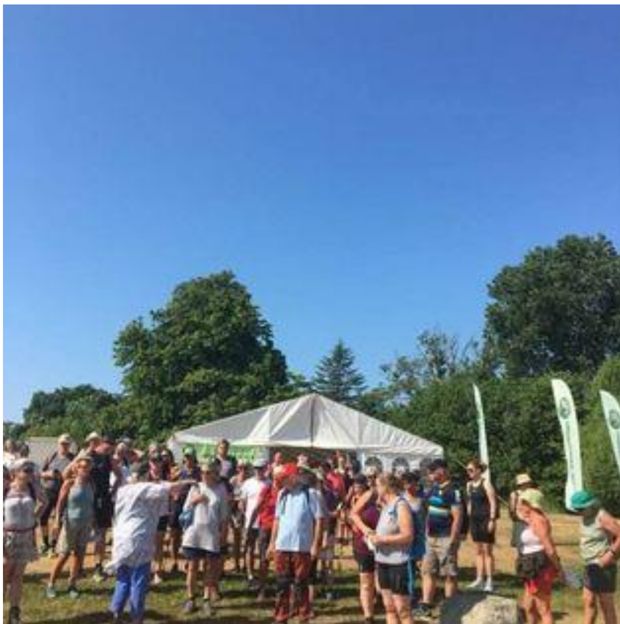
Eksempel på vores seneste aktivitet Midsommer Walk 2023 med 160 deltagere.